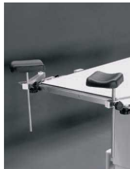
Βάσεις στήριξης των αγκώνων του γιατρού