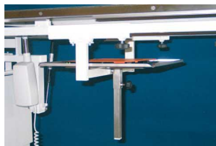
Συρτάρι για τοποθέτηση ακτινογραφικής κασσέτας