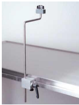
Βάση πρόσδεσης άκρου, με σφιγκτήρες