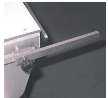
Επέκταση των OP-rails

Για να προστεθεί όποιο από τα παραπάνω accessories της Panno.Med στο τραπέζι VETLIFT, είναι υποχρεωτική η αγορά των OP – rails (set) καθώς όλα τα accessories προσαρμόζονται πάνω στο OP – rails (set).