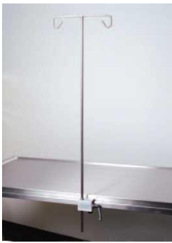
Βάση στήριξης ορού