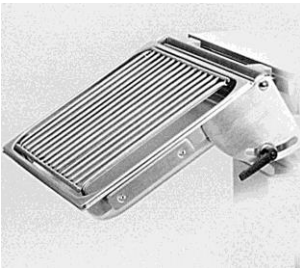
Ανοξείδωτη επικλινόμενη επέκταση, με πλέγμα