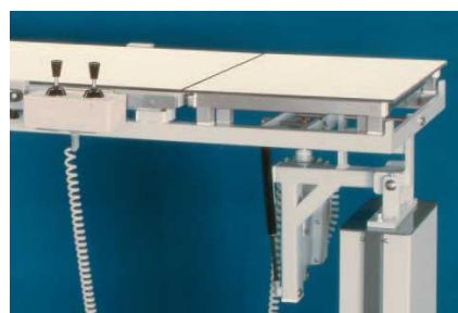
Σύστημα ελέγχου OP-System