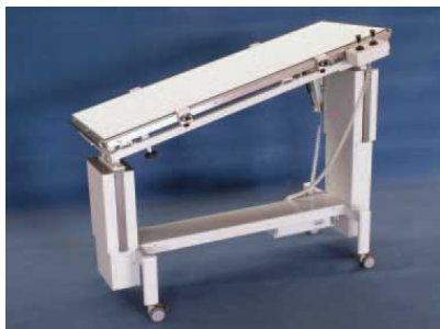
Κλίση μέσω ηλεκτρικού μηχανισμού κατά 15° προς και τις δύο πλευρές