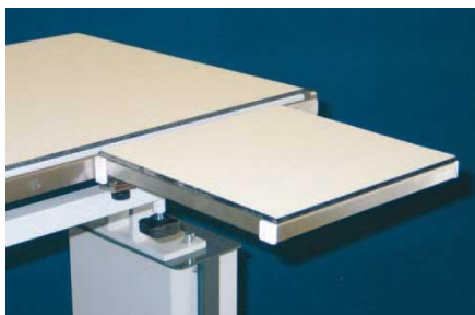
Επέκταση διαστάσεων 30 x 30cm