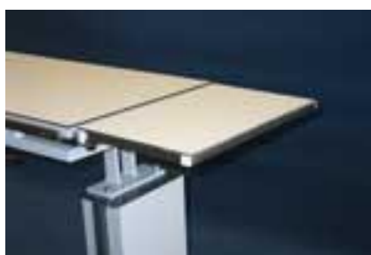
Επέκταση διαστάσεων 50 x 30 cm