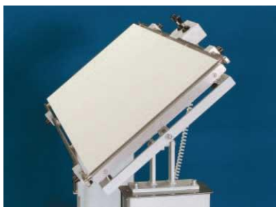
Εγκάρσια (πλευρική) κλίση, αριστερά και δεξιά, κατά 40° μέσω ηλεκτρικού μηχανισμού (ιδανική π.χ. για λαπαροσκοπικές επεμβάσεις)

Το επιτρεπόμενο βάρος φόρτωσης είναι 120 κιλά. Το OP-System μπορεί να δεχτεί μεγάλη σειρά από αξεσουάρ όπως στατώ ορού, τραπεζάκι εργαλείων, ανοξειδωτο κουβά συλλογής υγρών, ρυθμιζόμενα πλευρικά στηρίγματα, στηρίγματα ποδιών με σφιγκτήρες, ανοξειδωτή επικλινόμενη επέκταση με πλέγμα (για συλλογή υγρών από το χειρουργείο, καθαρισμό δοντιών κλπ.), κ.ά.