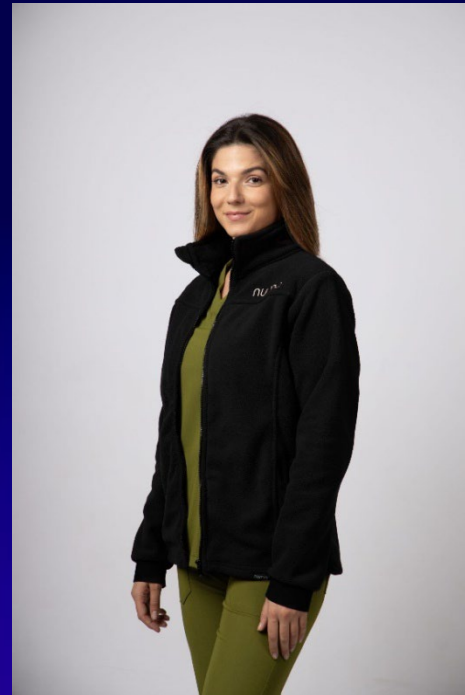
Fleece – Huggi