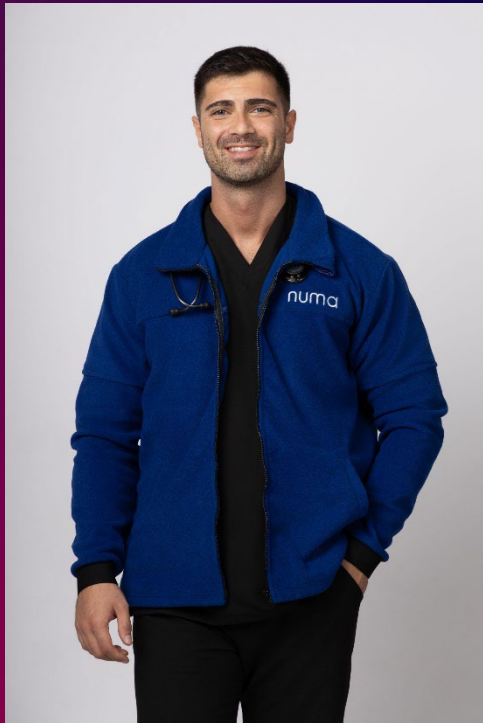
Fleece – Fleezy